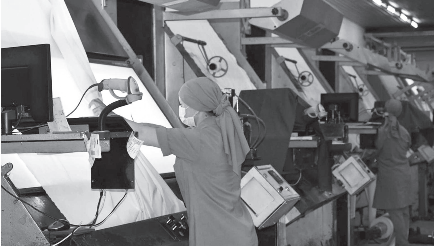
Faşizme karşı en kararlı, en dinamik güçlerle ortak iş yapmaya çalışmak, kısa ve uzun vadeli eylem birlikleriyle hareket etmek önemlidir. Halihazırda bunun somut koşulları da vardır.

düşündükleri kurumları kendi iktidarlara göre düzenlemeye devam etmektedirler. Bekçi yasasından, çoklu baroya, propaganda başkanlığının kurulmasından, TTB'nin kapatılması hamlelerine kadar bir dizi saldırı ortadadır. Şimdi bu hamlelere, Anayasa Mahkemesi'nin yeniden düzenlenmesi ve idamın geri getirilmesi tartışmaları da eklenmiş durumdadır.