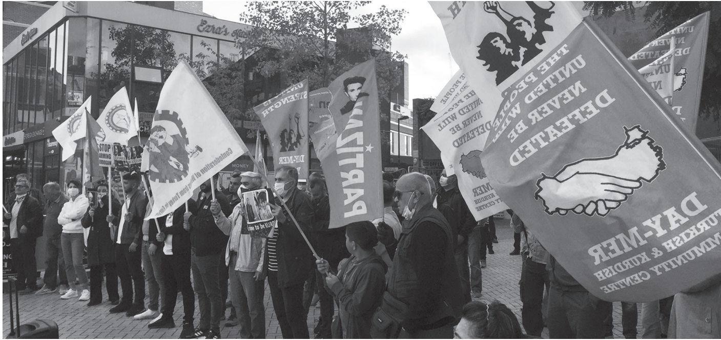
Avusturya Viyana'da gerçekleştirilen ırkçı saldırılar protesto ediliyor | 26 Haziran 2020

Çok kapsamlı saldırıları bertaraf edecek politik öngörü ve inatla mevzileri koruyacak dirayet ve teşhir politikası bu süreçte kan kaybını durdurabilir.